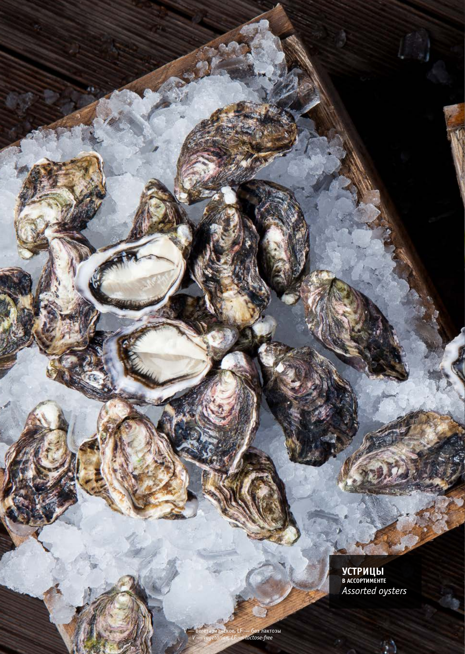
УСТРИЦЫ В АССОРТИМЕНТЕ Assorted oysters

V — вегетарианское, LF — без лактозы V — vegetarian, LF — lactose-free