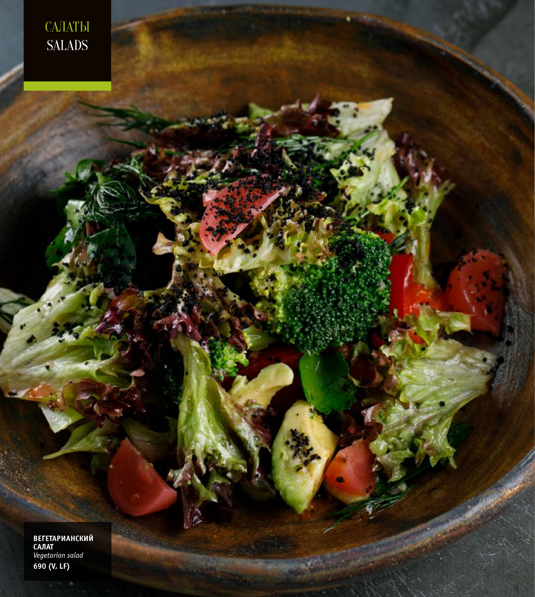
ВЕГЕТАРИАНСКИЙ САЛАТ Vegetarian salad 690 (V, LF)

V — вегетарианское, LF — без лактозы V — vegetarian, LF — lactose-free