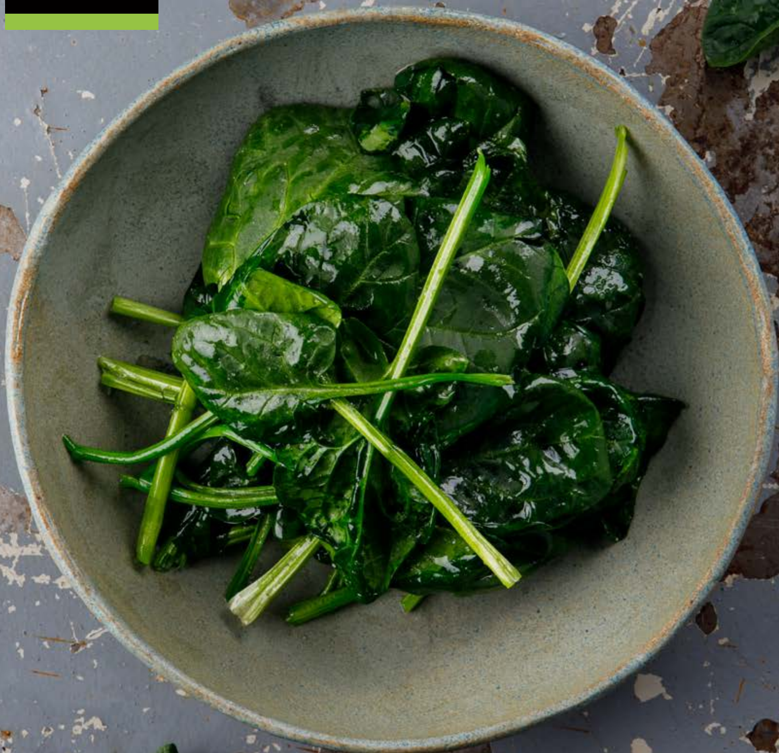
ШПИНАТ Spinach 490 (V, LF)

V — вегетарианское, LF — без лактозы V — vegetarian, LF — lactose-free