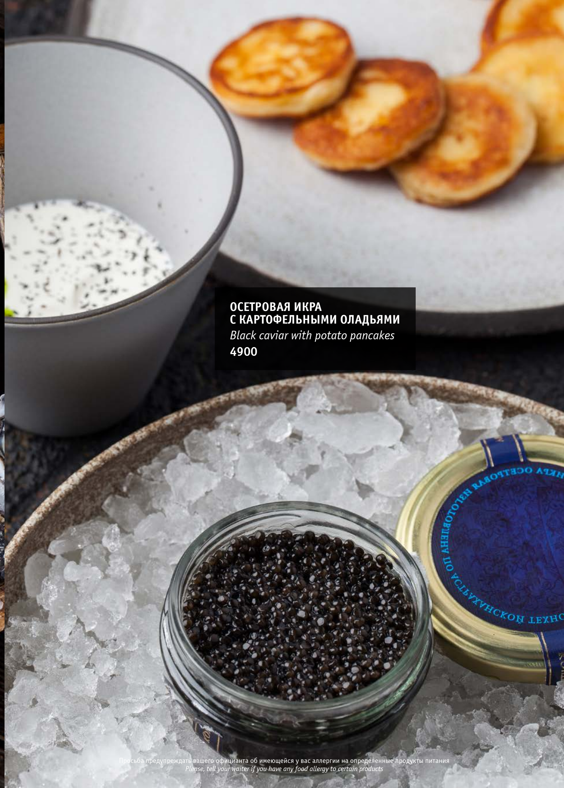
ОСЕТРОВАЯ ИКРА С КАРТОФЕЛЬНЫМИ ОЛАДЬЯМИ Black caviar with potato pancakes 4900

V — вегетарианское, LF — без лактозы V — vegetarian, LF — lactose-free