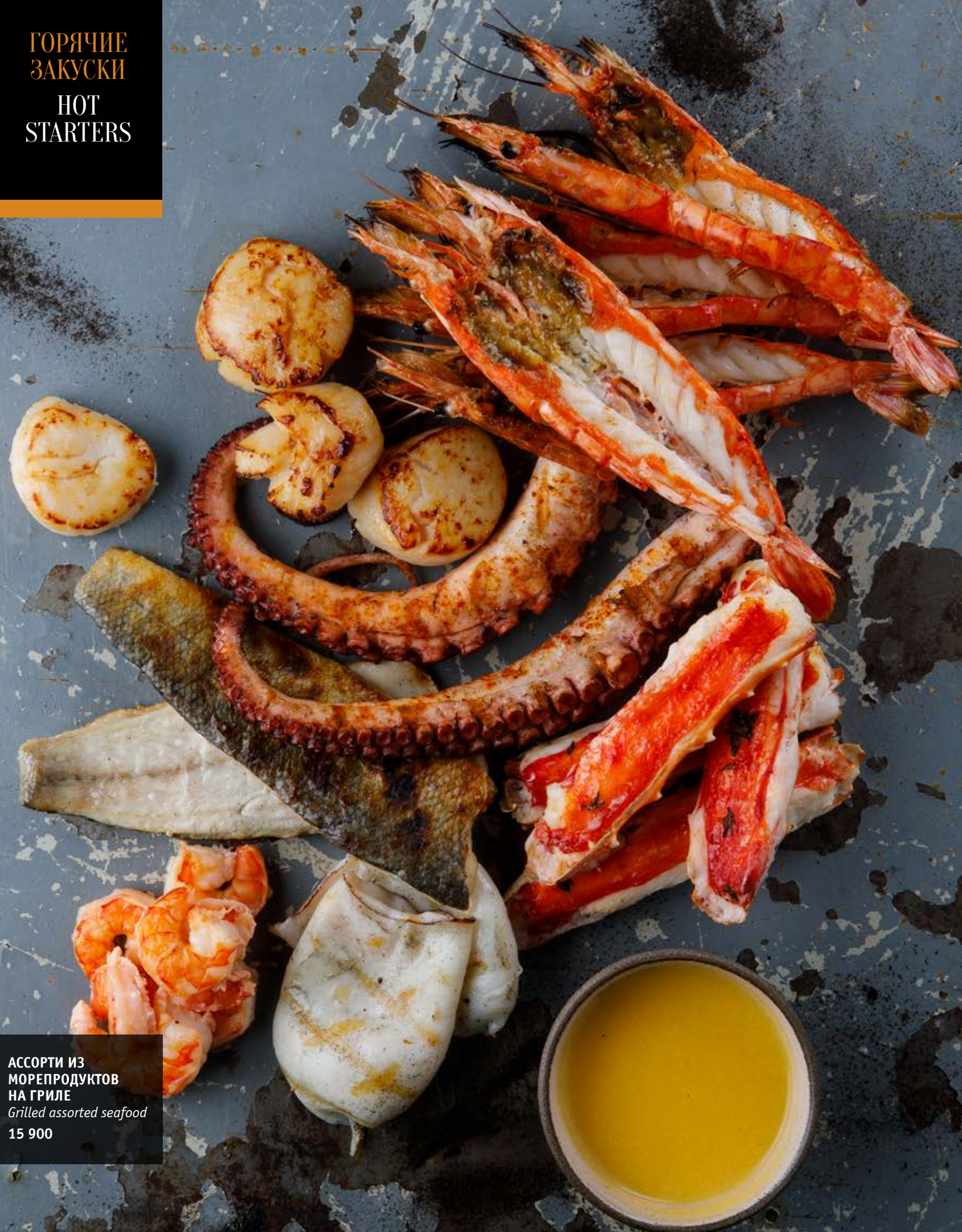
АССОРТИ ИЗ МОРЕПРОДУКТОВ НА ГРИЛЕ Grilled assorted seafood 15 900

V — вегетарианское, LF — без лактозы V — vegetarian, LF — lactose-free