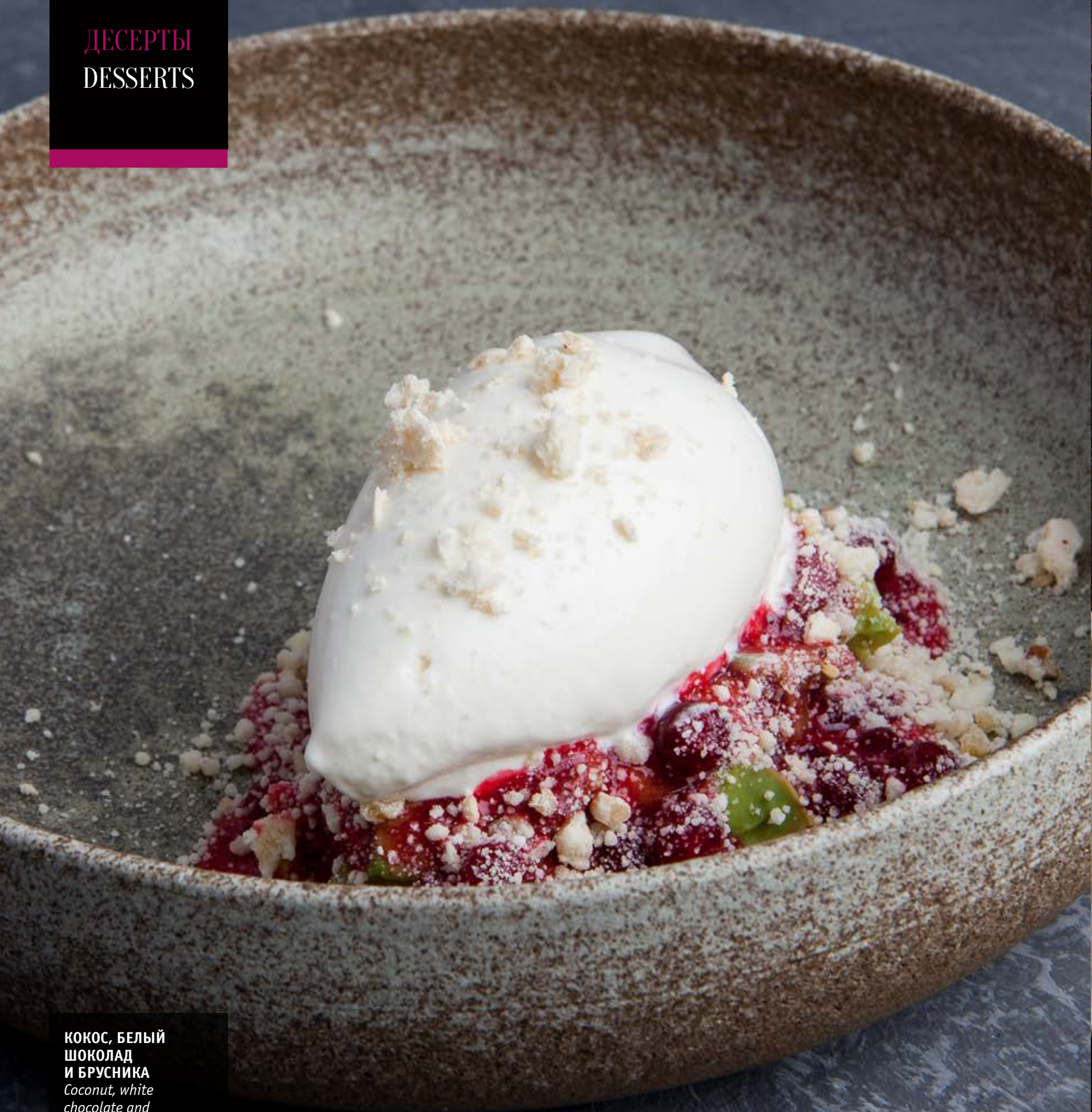
КОКОС, БЕЛЫЙ ШОКОЛАД И БРУСНИКА Coconut, white chocolate and red bilberry 490

V — вегетарианское, LF — без лактозы V — vegetarian, LF — lactose-free